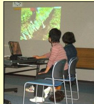
活動ようすの映写