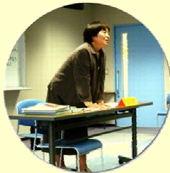
あすなろスタッフ